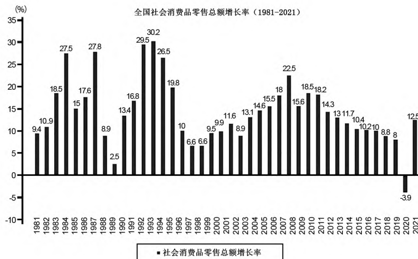
图1 1981—2021年全国社会消费品零售总额增长率波动

中国宏观经济运行客观上存在着波动。这种波动一般表现为国民生产总值和国民收入增长幅度的变化。市场容量的衡量指标主要是社会商品零售额和生产资料销售额,其规模大小主要取决于国民生产总值和国民收入规模。因而市场容量是国民生产总值和国民收入的函数。图1是1981—2021年中国社会商品消费品零售总额增长率波动,由图1可知,国民生产总值和国民收入的波动在市场上会引起社会商品零售总额和物资销售额的同步波动。